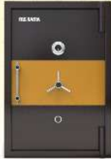
42" x 27" x 24"