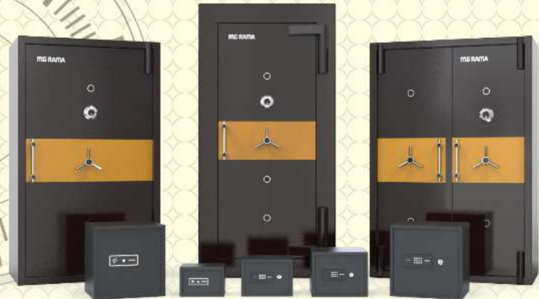
PROTECTOR ARMOUR SAFE

The contents and information on the catalogue is for general purposes and is provided on 'as is' basis. The recommendations of level of strength are relative and completely depend on the nature of tools used for any attack. All safes can be broken open given sufficient time, tools, torch (Basic or simple home tools) expert skill and access. All warranties, recommendations and representations of any kind mentioned herein are disclaimed, including the implied warranties of merchantability and fitness for a particular use. The Company disclaims any claims, losses, demands, or damages of any kind whatsoever arising out of or resulting by reason or in consequence of any illegal breaking open of Home / Office Safes, fraud or other wrongful act done by any third Party with regard to Home / Office Safes, including but not limited to direct, indirect, incidental, or consequential loss or damages, compensatory damages, injury, economic loss, or otherwise resulting from theft, fire, robbery, fraud or other wrongful act done by any third Party. The specifications, prices and features of the products may be changed at the sole discretion of the Company without prior notice. ISO 9001:2015, ISO 22000:2005 and CE certified company.