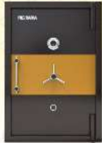
36" x 24" x 24"