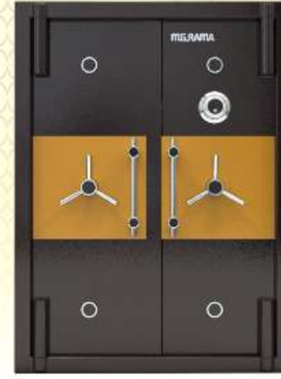
72" x 42" x 30"