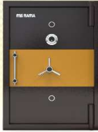
60" x 33" x 27"