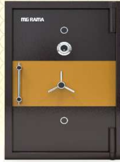
72" x 42" x 30"