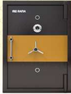
48" x 33" x 27"